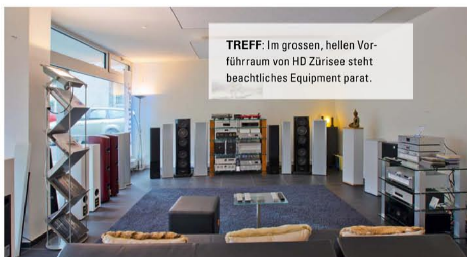
TREFF: Im grossen, hellen Vorführraum von HD ZÜRISSEE steht beachtliches Equipment parat.

Da waren dann auch die 1210er wieder da: optisch den Klassikern ähnlich,